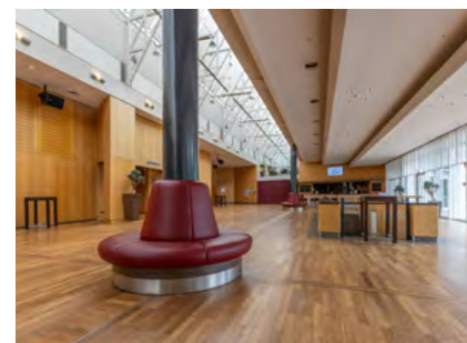
Das obere Foyer